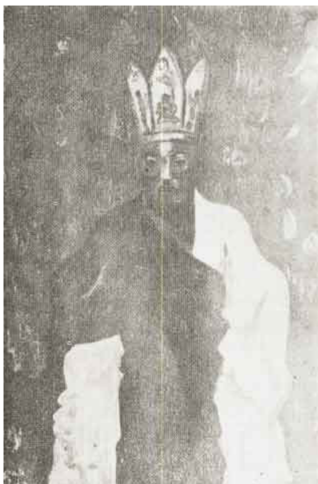
Superior de un Monasterio Tibetano. (Pintura del Autor)