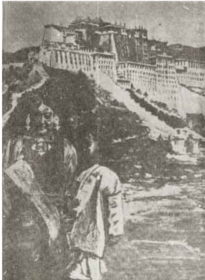
Palacio del Dalai-Lama en Lhasa. (Pintado por el Maestre).